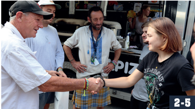
СЛОБОЖАНСЬКА ГРОМАДА: 2022 РІК ЗМІЦНИВ, ЗГУРТУВАВ ТА НАВЧИВ ЦІНУВАТИ ДРІБНИЦІ