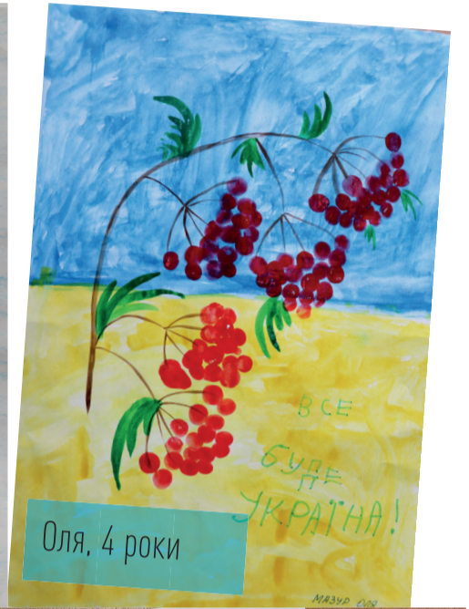
Оля, 4 роки