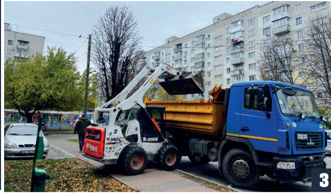
ЯК ПРАЦЮЄ ГАЛУЗЬ ЖКГ ПІД ЧАС ВІЙНИ