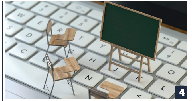
НАВЧАННЯ В ВОЄННИЙ ЧАС: ПРО КОМПРОМІСИ, ФАХОВІСТЬ І ЧІТКУ ВЗАЄМОДІЮ